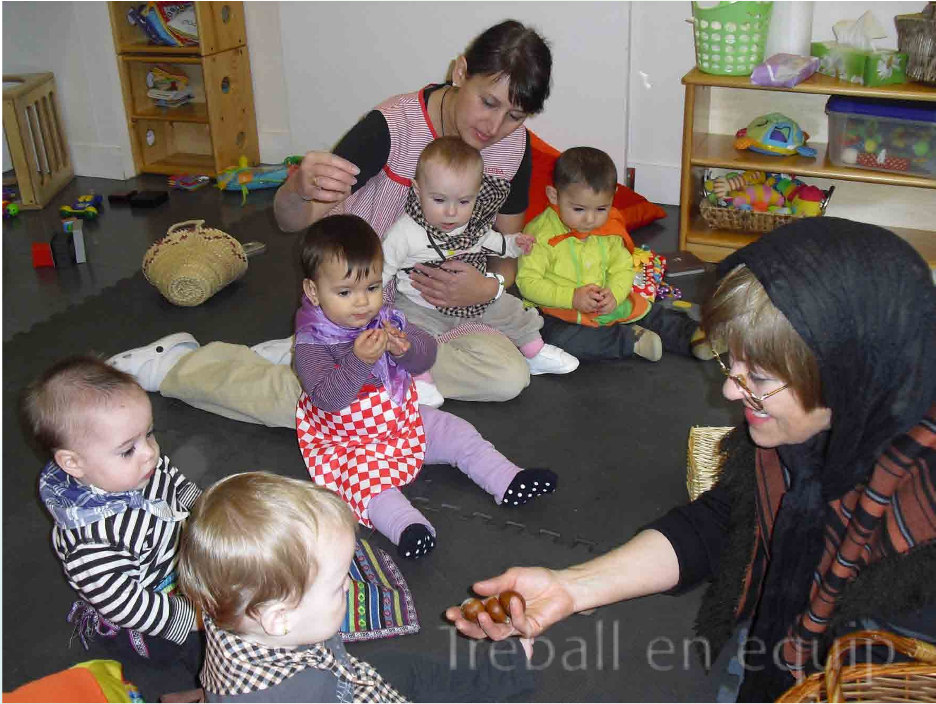
Treball en equip